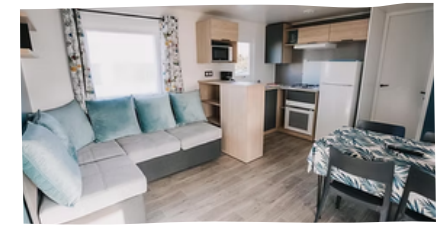
MOBIL-HOME 4 PLACES**

*TAXE DE SÉJOUR EN SUS, TVA INCLUSE TAUX EN VIGUEUR AU 01/01/25