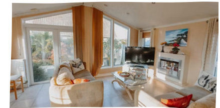
MOBIL-HOME PRESTIGE 6 PLACES**