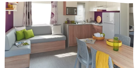
MOBIL-HOME 6 PLACES**